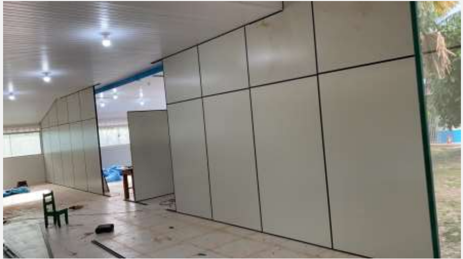
Imagem 5– Divisórias.