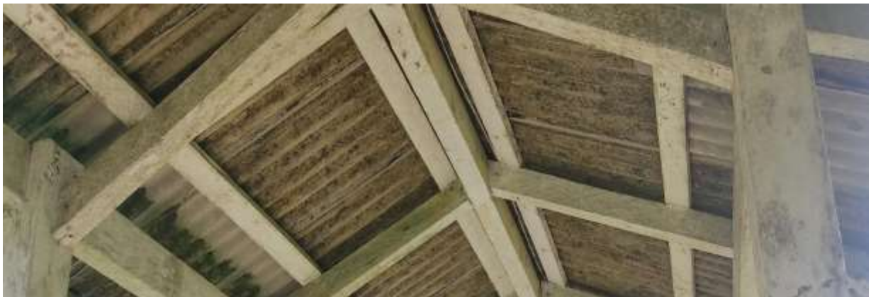
Imagem 08 em 01/04/2022