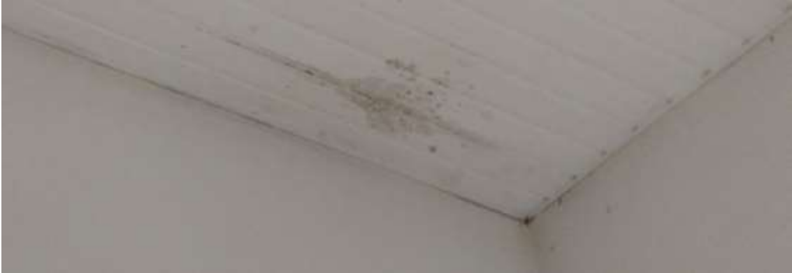
Imagem 10 em 01/04/2022