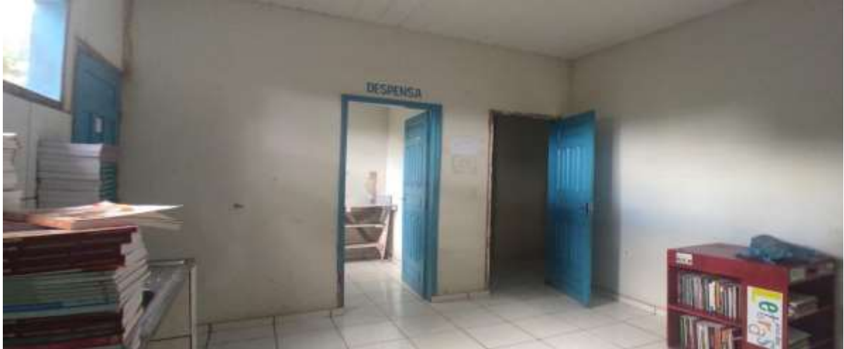
Imagem 07 em 01/04/2022