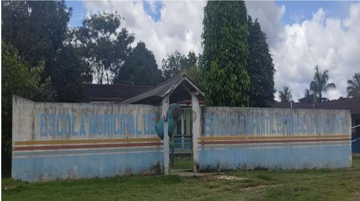
Imagem 01 em 01/04/2022