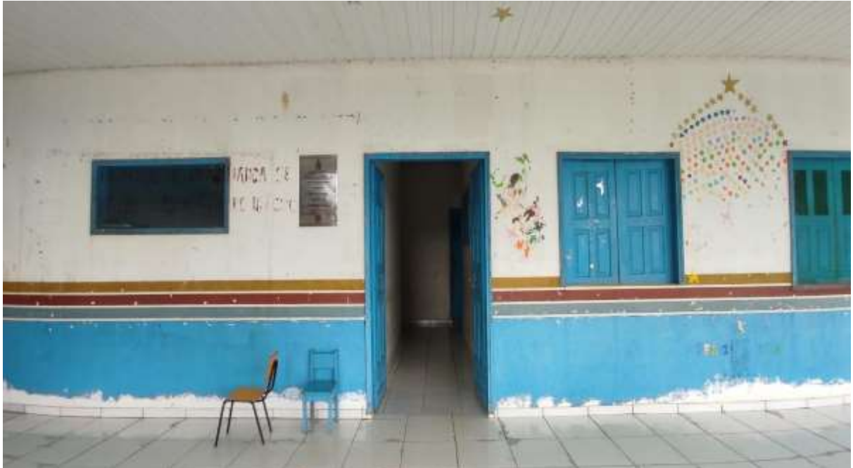
Imagem 03 em 01/04/2022