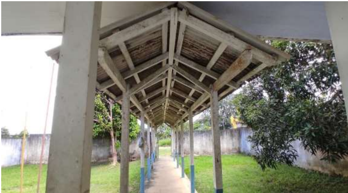
Imagem 02 em 01/04/2022