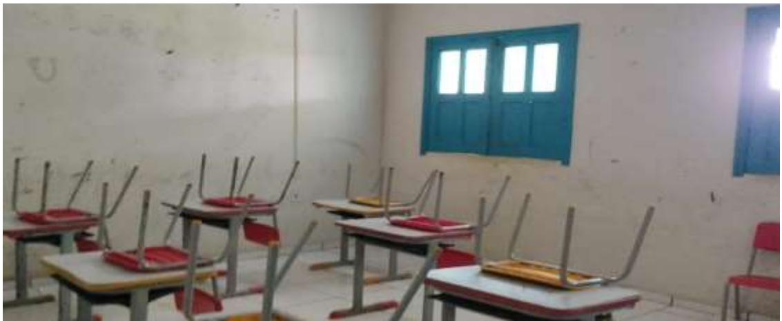
Imagem 11 em 01/04/2022