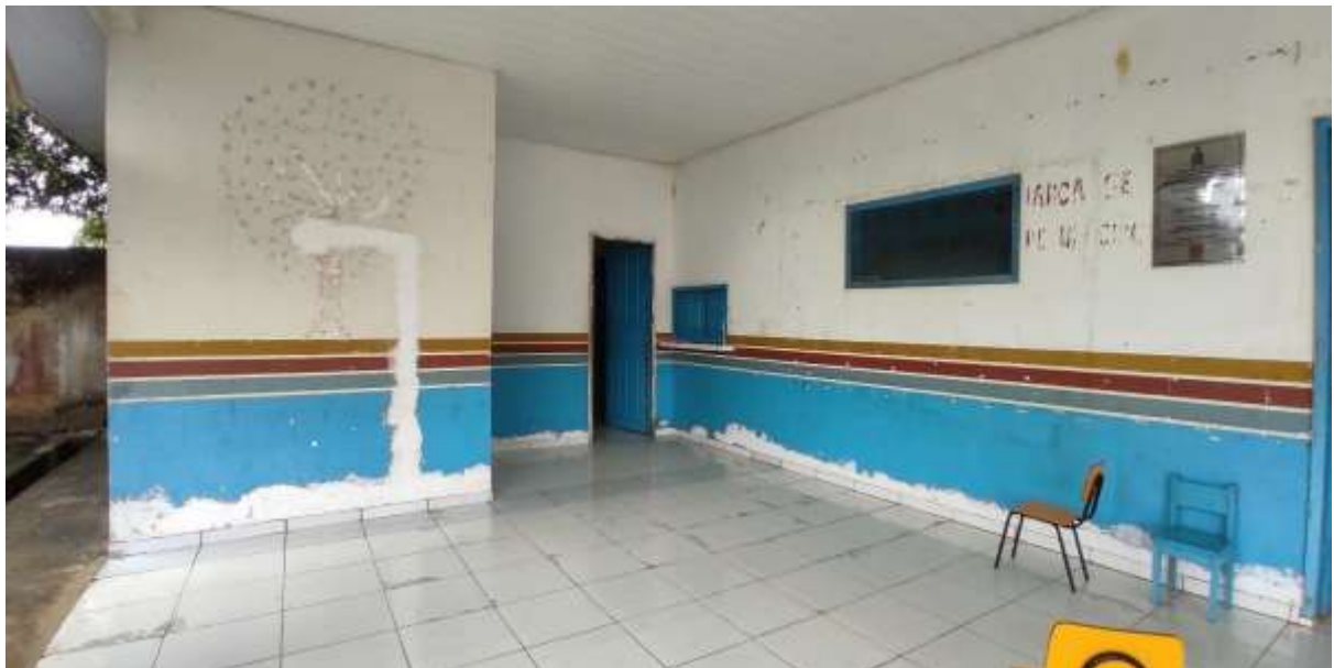
Imagem 04 em 01/04/2022