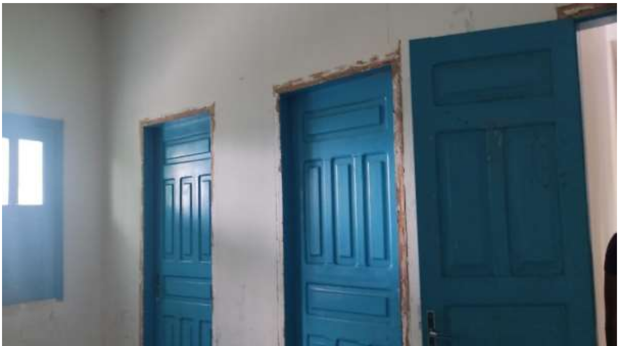
Imagem 06 em 01/04/2022