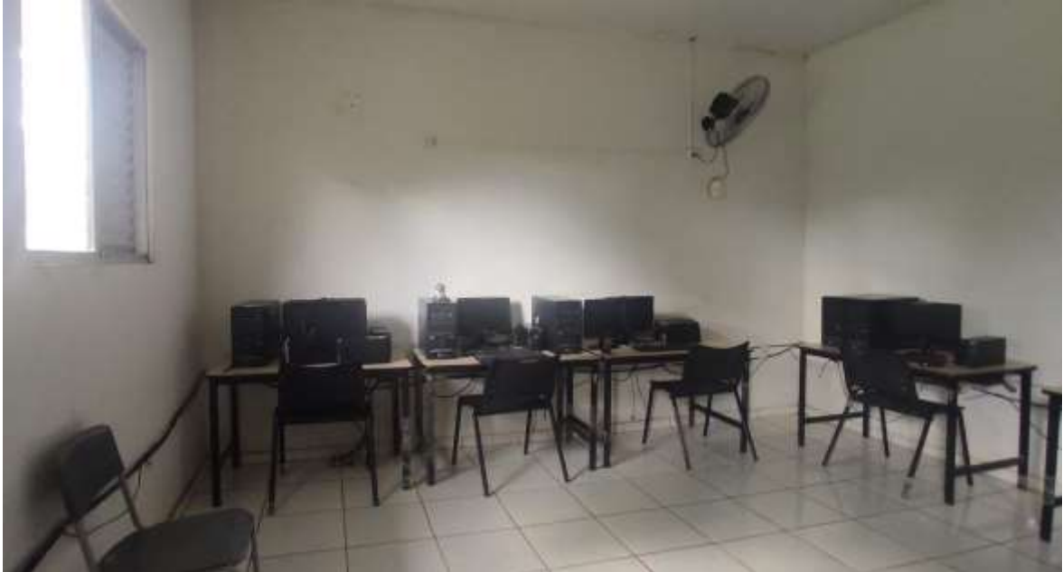
Imagem 05 em 01/04/2022