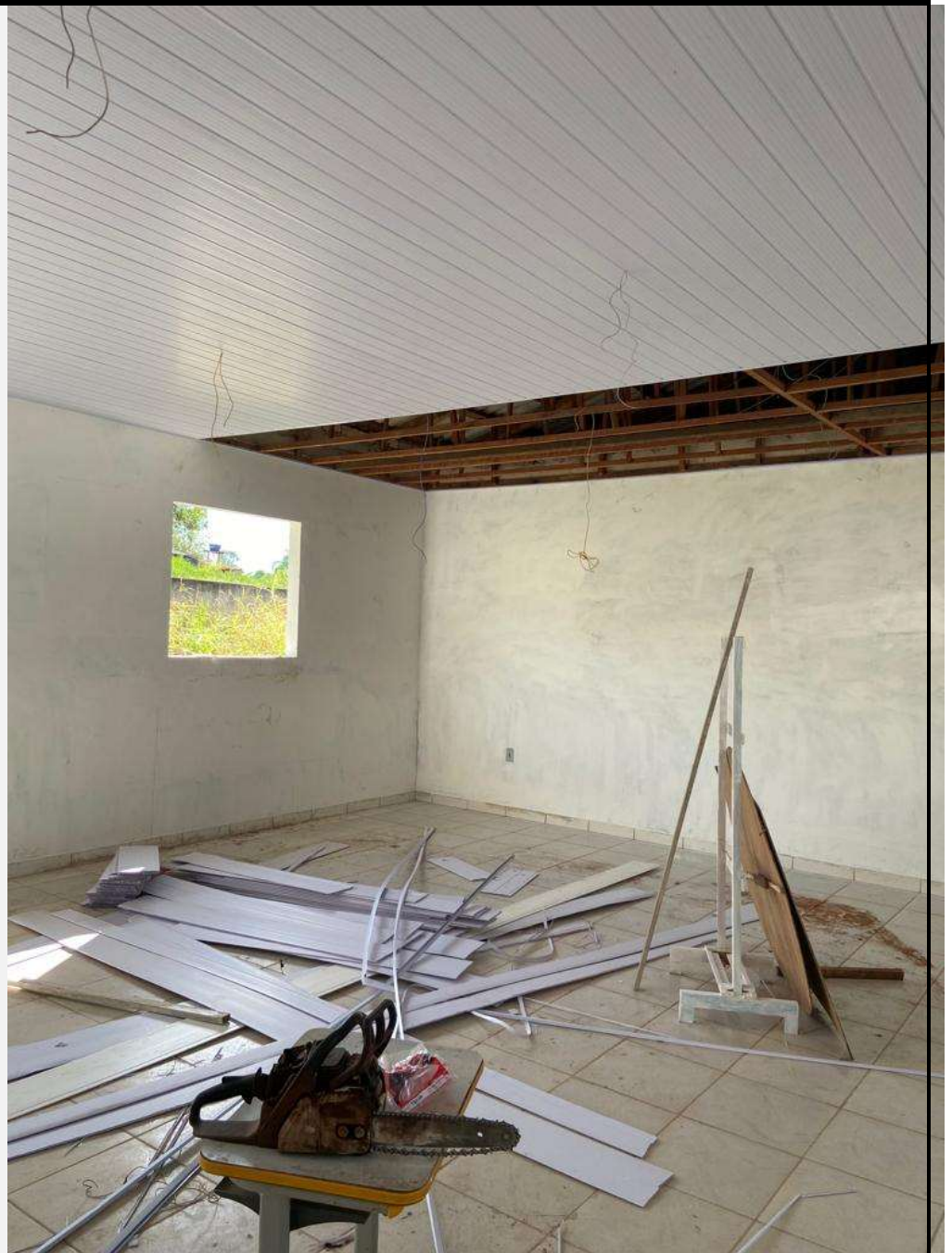
Imagem 3– instalação de forro.