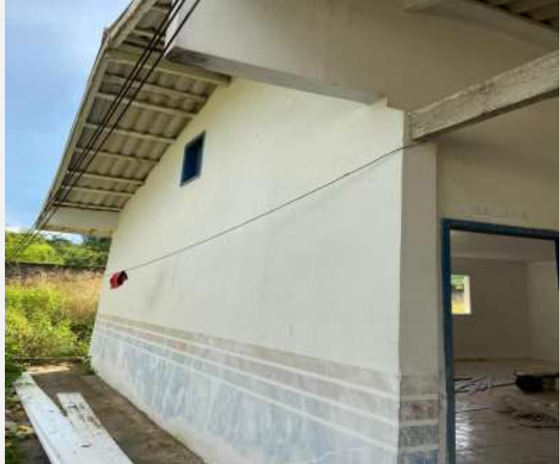
Imagem 6– serviço de pintura.