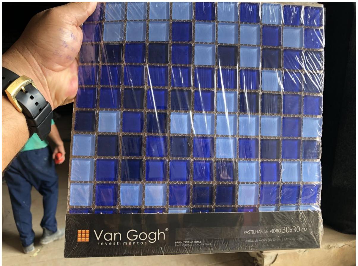
Modelo da pastilha de vidro para detalhes na cores da fachada. (Vermelho; verde; amarelo e azul)