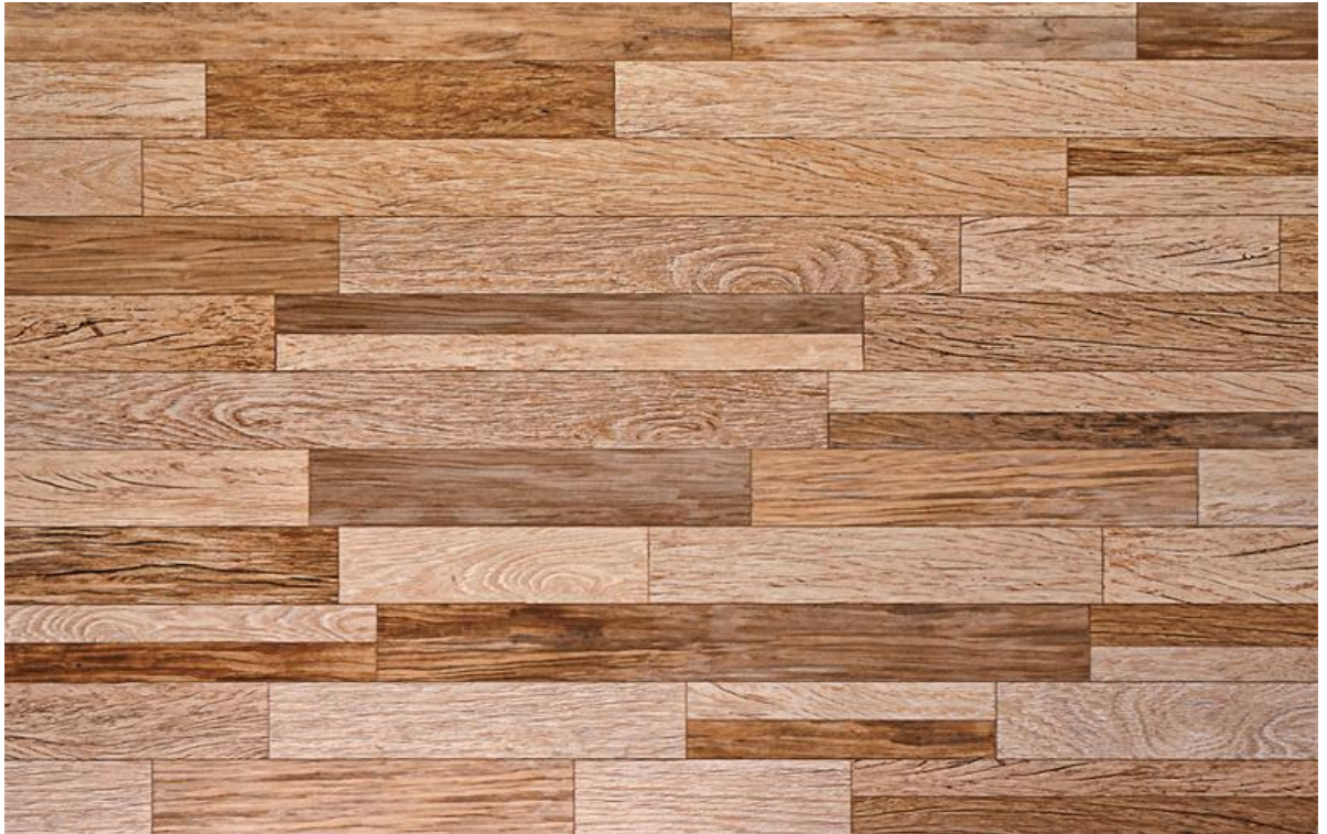
Cerâmica tipo pedra