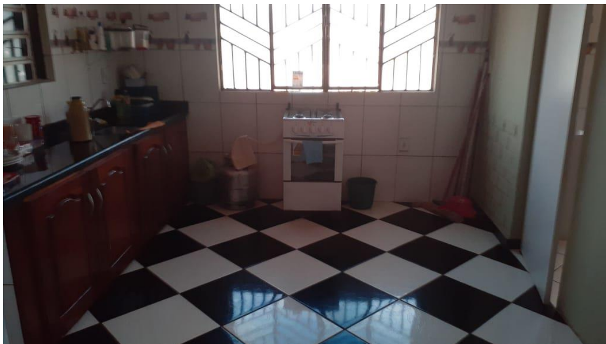
Figura 04 – Área interna destinada aos serviços de atendimento da representação da PMJ