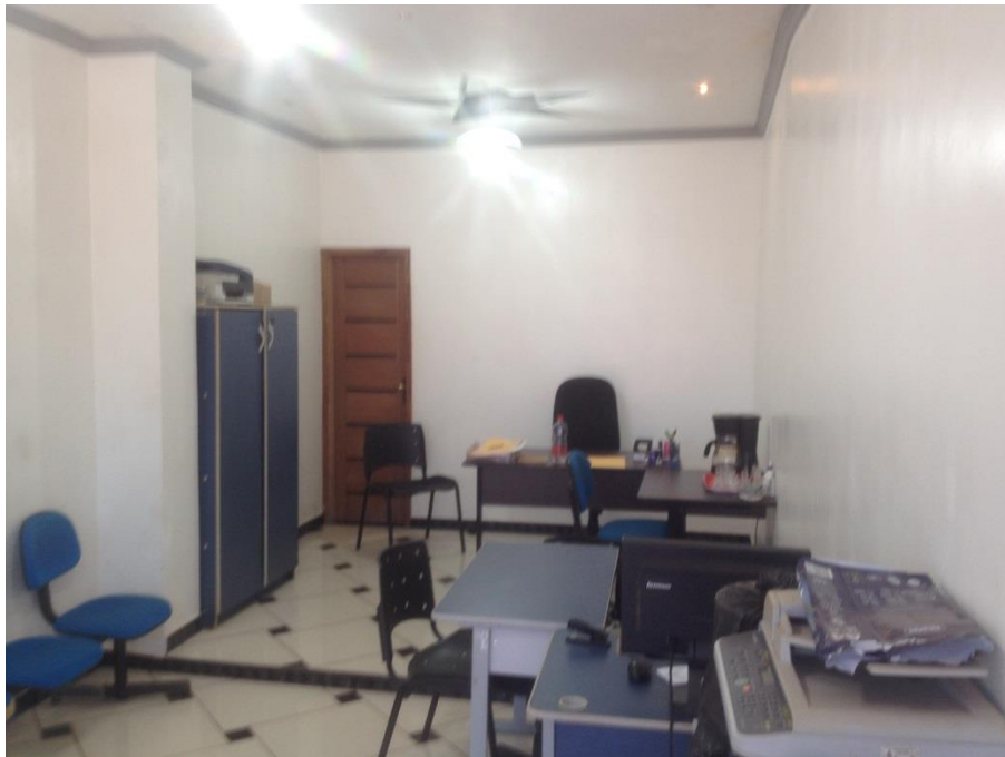
Área interna destinada aos serviços da Secretaria Municipal de Administração.