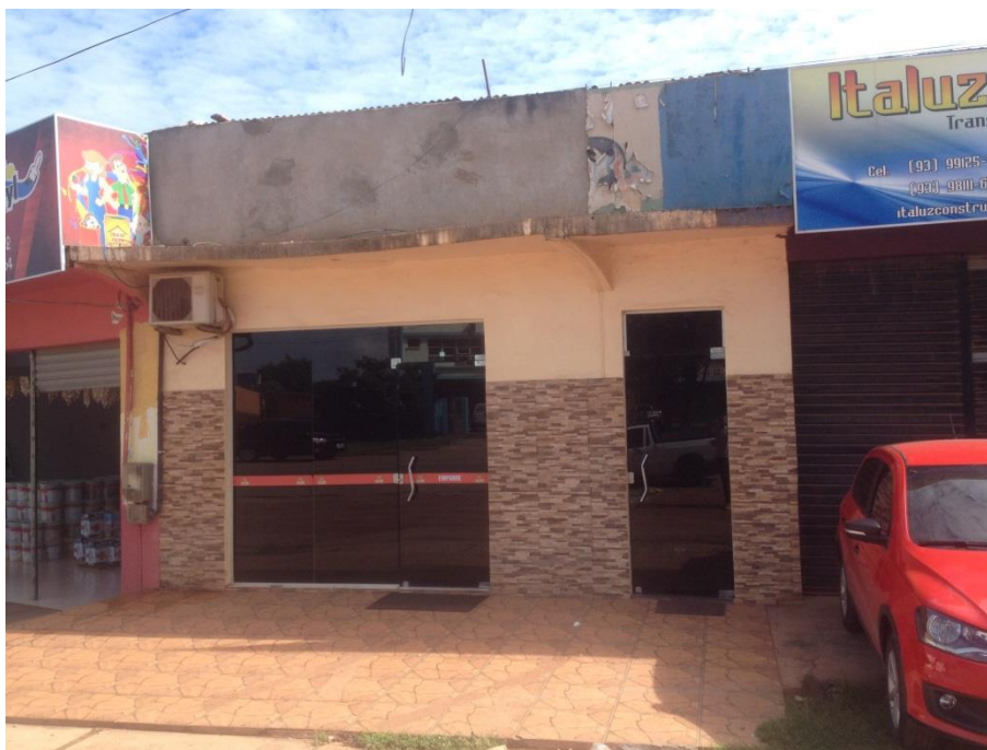
Vista Frontal da fachada da edificação.