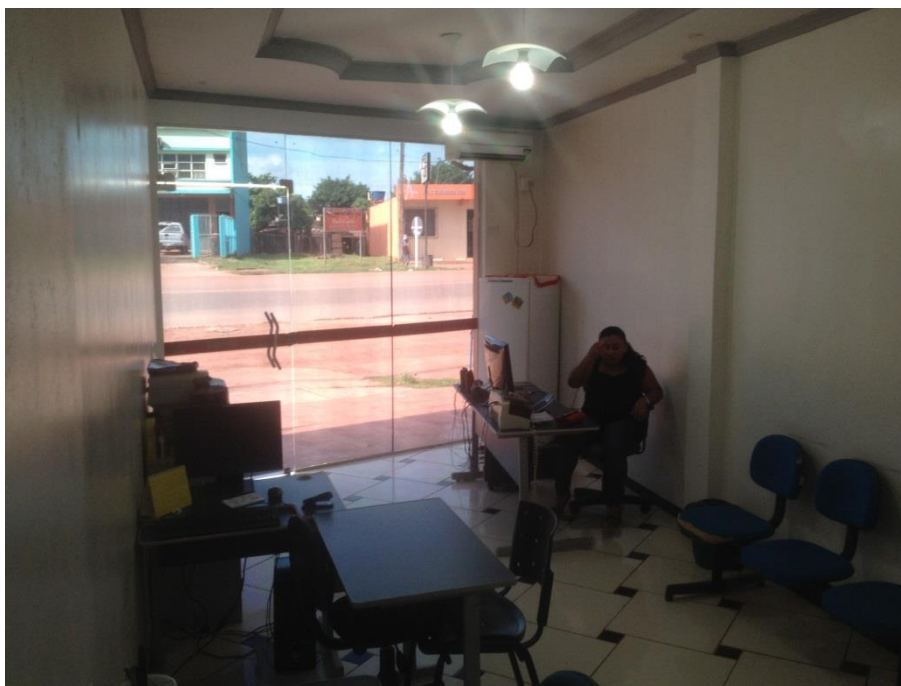
Área interna destinada aos serviços da Secretaria Municipal de Administração.